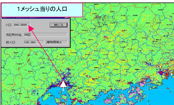
Fig.2 土地利用地図と1メッシュ当りの人口表示 (各市区町村内の土地利用別メッシュ総数の計算と記憶)